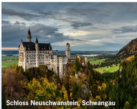
Schloss Neuschwanstein, Schwangau

Schwangau → Linderhof → Herrenchiemsee → Schönau am Königssee