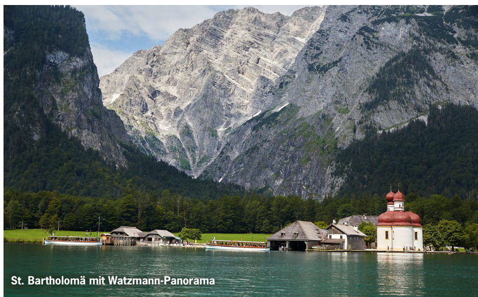
St. Bartholomä mit Watzmann-Panorama