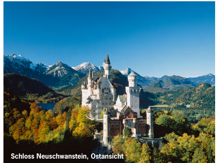
Schloss Neuschwanstein, Ostansicht

Von Ludwig II. seit 1869 hoch über dem Schloss Hohenschwangau seines Vaters in vertrauter Umgebung errichtet und nie vollendet, war Neuschwanstein für ihn Denkmal der Kultur und des Königtums des Mittelalters, das er verehrte und nachvollziehen wollte. Gestaltet und ausgestattet in mittelalterlichen Formen, aber mit damals modernster Technik, ist es eines der weltweit bekanntesten Bauwerke und ein Hauptsymbol des deutschen Idealismus. Für die Baugestalt war die Wartburg wichtiges