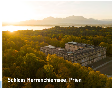
Schloss Herrenchiemsee, Prien