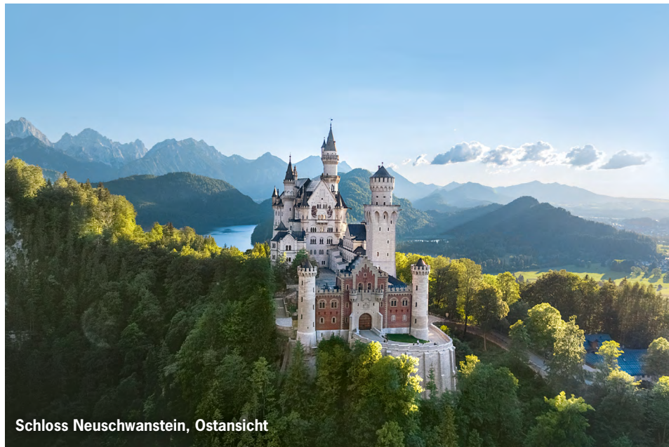
Schloss Neuschwanstein, Ostansicht