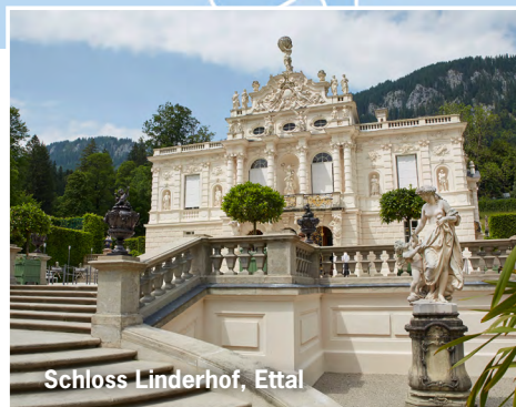
Schloss Linderhof, Ettal