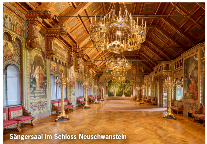
Sängersaal im Schloss Neuschwanstein