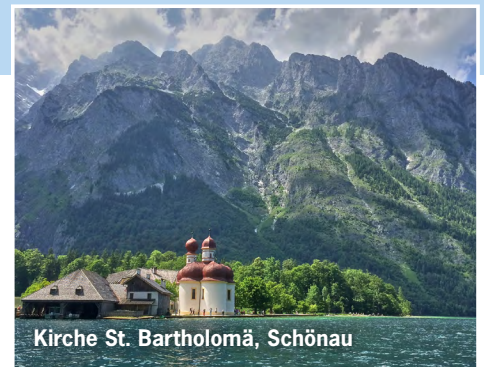
Kirche St. Bartholomä, Schönau