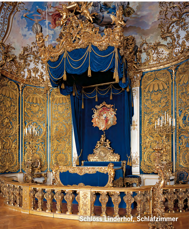
Schloss Linderhof, Schlafzimmer