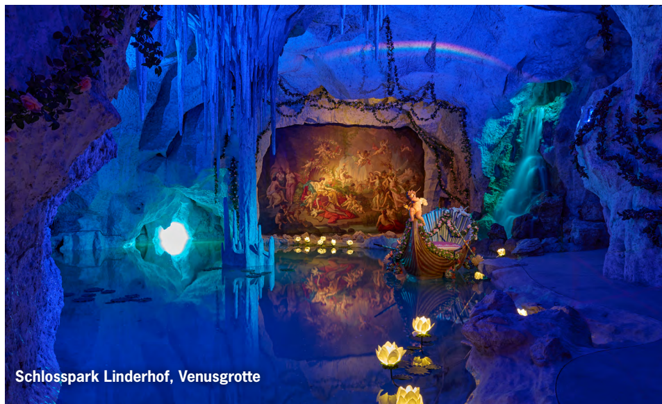
Schlosspark Linderhof, Venusgrotte