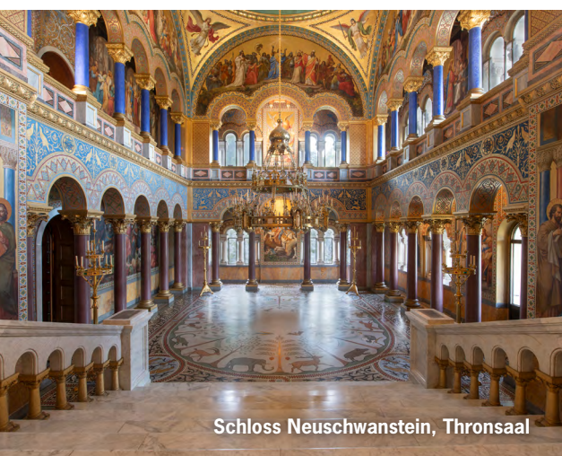
Schloss Neuschwanstein, Thronsaal