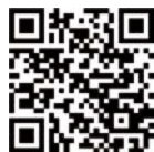
QR-Code zum Download der Walhalla-App

Freies WLAN verfügbar Walhalla-App zum Download (deutsch, englisch, französisch, tschechisch, russisch)