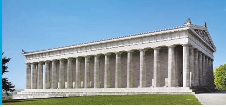
Die Walhalla von Osten

Bayerischer Staatsminister der Finanzen und für Heimat