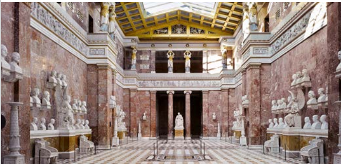
Marmorbüsten von J. W. von Goethe, Sophie Scholl und Max Planck