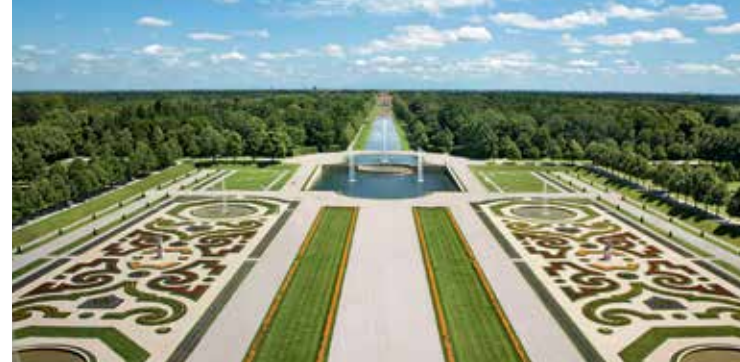
Blick vom Neuen Schloss Schleißheim über das Parterre, die Kaskade und den Mittelkanal zu Schloss Lustheim