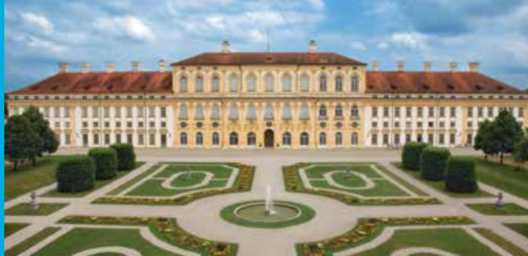
Neues Schloss Schleißheim

Bayerischer Staatsminister der Finanzen und für Heimat