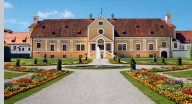
Altes Schloss Schleißheim

Großer Saal mit Deckenfresko, Jacopo Amigoni, 1722 (li.); Paradeschlafzimmer im Appartement des Kurfürsten (re.)