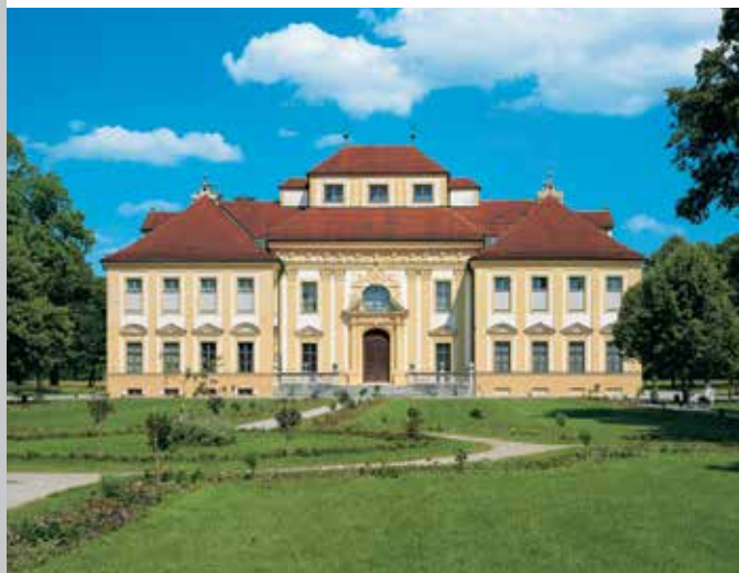
Castello di Lustheim

Le ambizioni politiche del principe elettore Massimiliano Emanuele di Baviera trovarono espressione nella costruzione del Castello Nuovo di Schleißheim. Originariamente progettato su più ali, il suo corpo principale – corrispondente all'attuale castello – venne costruito al grezzo su disegni di Enrico Zuccalli. L'esilio della durata di undici anni di Massimiliano Emanuele, in seguito alla sconfitta nella Guerra di successione spagnola, bloccò il progetto edilizio. Solo a