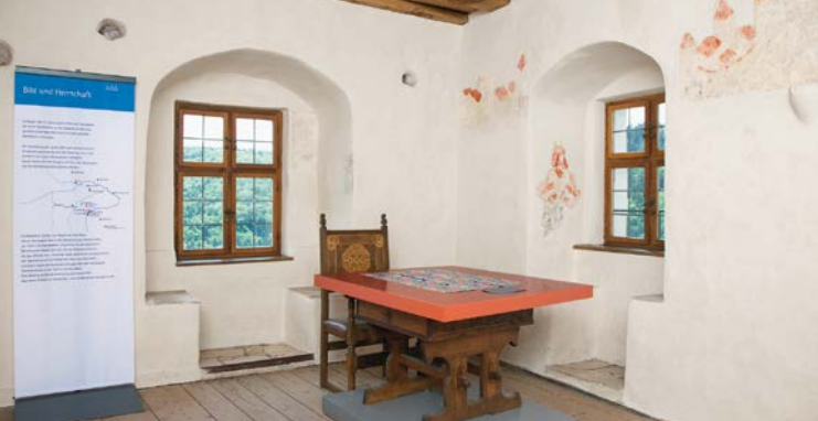
Herrschaftszimmer mit zahlreichen Wandmalereien

das Nibelungenlied. Die um 1330 entstandene Handschrift wurde vom herzoglichen Hofrat Wiguläus Hund auf der Burg gefunden. 1575 machte er den kostbaren Pergamentcodex Herzog Albrecht V. für seine Bibliothek zum Geschenk. Heute befindet sich die Handschrift in der Bayerischen Staatsbibliothek. Nach mehrmaligem Besitzwechsel ging die Burg 1672 in den Besitz der Ingolstädter Jesuiten über. Die Neugestaltung der Burgkapelle mit reizvollem barockem Stuckdekor ist das wichtigste Zeugnis ihrer Bautätigkeit. Seit 1823 ist die Burg wieder im Besitz der Wittelsbacher. König Ludwig I. von Bayern setzte sich 1827 für den Erhalt der Burganlage als historisches Denkmal ein und bewahrte sie vor dem drohenden Verfall. Der 2012 neu konzipierte Ausstellungsrundgang verbindet die Geschichte der Burg und ihrer Bewohner mit den unterschiedlichen Facetten des Nibelungenliedes. So erfahren die Besucherinnen und Besucher Spannendes zu Themen wie Jagd, Kleidung, Recht, Turniere und Festlichkeiten – sowohl im Leben der Burgherren als auch im Nibelungenlied.