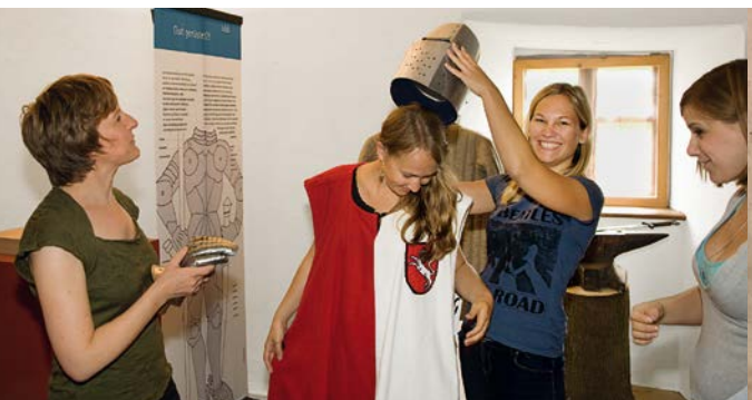
Das Mittelalter zum Anfassen und Anziehen

Steil ragt die Burg Prunn auf einem Kalksteinfelsen 70 Meter über dem malerischen Altmühltal auf. Die Herren von Prunn sind erstmals 1037 urkundlich erwähnt. Bis ins 16. Jahrhundert herrschten hier die mächtigen Adelsfamilien der Laaber und Fraunberger. Der Burgbau selbst mit dem wuchtigen Bergfried reicht in die mittelalterliche Blütezeit der Kelheimer Region um 1200 zurück. Unter der Herrschaft der Fraunberger erlebte die Anlage ab dem 14. Jahrhundert – in der Zeit der Spätgotik – eine zweite Blütezeit. Davon zeugen mehrere Umbaumaßnahmen wie beispielsweise die Aufstockung des repräsentativen Wohnturms an der Südseite der Burg. Im Zusammenhang mit diesem Anbau stehen auch die erhaltenen Wandmalereien aus dem frühen 15. Jahrhundert im ehemaligen Herrschaftszimmer. Die Burg Prunn ist Fundort des sogenannten »Prunner Codex«. Jener überliefert in mittelhochdeutscher Sprache das bekannteste mittelalterliche Heldenepos: