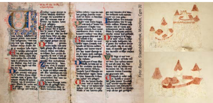
Cgm 31