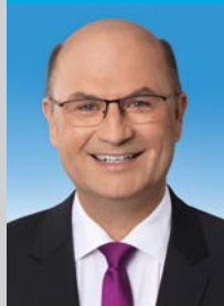
Albert Füracker, MdL Ministro de estado

!Le deseamos una emocionante visita a la Isla Herreninsel!