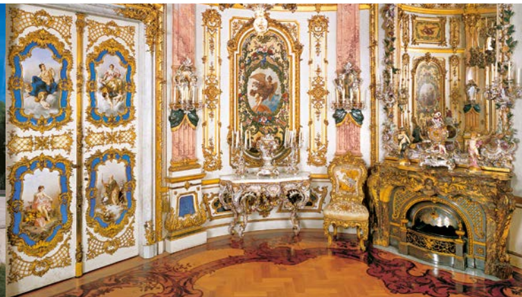
Gabinete de Porcelana de Luis II, siguiendo el ejemplo del Rococó, Manufactura de Meissen, 1884–1886