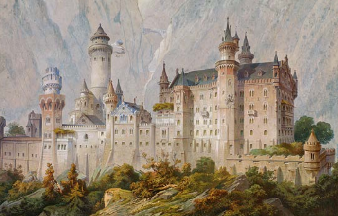
Boceto ideal no ejecutado del Castillo Neuschwanstein, realizado por el pintor de Teatros Christian Jank en 1869; Museo del Rey Luis II (WAF München)

retratos y documentos escritos, así como maquetas y decoraciones de teatro. Los “palacios reales” de Neuschwanstein, Linderhof y Herrenchiemsee están documentados, igual que otros proyectos arquitectónicos de Luis II. Entre lo más destacado del museo figuran muebles imperiales originales de los apartamentos reales destruidos del Palacio Residencial de Múnich o del primer dormitorio del Palacio de Linderhof. Las piezas de artesanía de gala y ostentación, realizadas por encargo del Rey, demuestran el rango europeo del arte muniqués en la segunda mitad del siglo XIX.