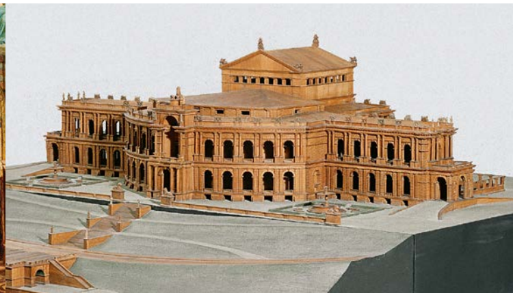
Maqueta para un Festival de Teatro de Richard Wagner, diseñado entre 1864 y 1866, Museo del Rey Luis II

retratos y documentos escritos, así como maquetas y decoraciones de teatro. Los “palacios reales” de Neuschwanstein, Linderhof y Herrenchiemsee están documentados, igual que otros proyectos arquitectónicos de Luis II. Entre lo más destacado del museo figuran muebles imperiales originales de los apartamentos reales destruidos del Palacio Residencial de Múnich o del primer dormitorio del Palacio de Linderhof. Las piezas de artesanía de gala y ostentación, realizadas por encargo del Rey, demuestran el rango europeo del arte muniqués en la segunda mitad del siglo XIX.