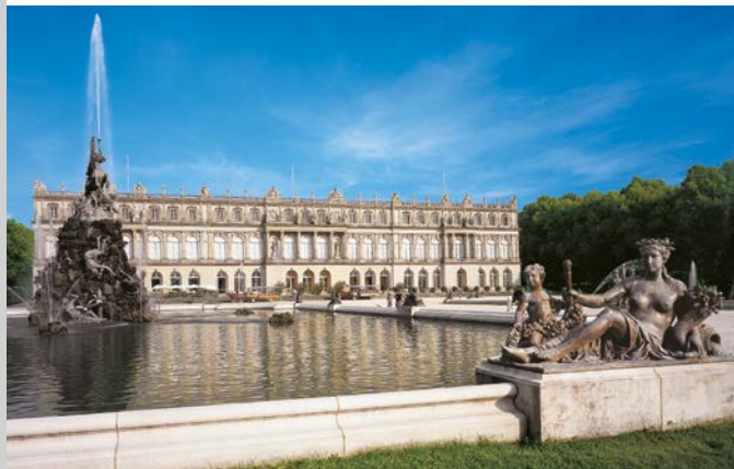
Fachada del Palacio Real de Herrenchiemsee, estanque del norte con Fuente de Fama