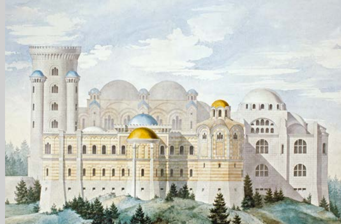
Boceto de un palacio bizantino, acuarela de Julius Hofmann, 1885; Diario personal del Rey Ludwig II, con grabado del Santo Grial, ambos en el Museo del Rey Luis II