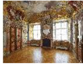
KemRes.II, Schlafzimmer, DI015552, BSV-