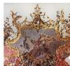
KemRes.II, Tagzimmer, Eckkartusche, DI015569, BSV-