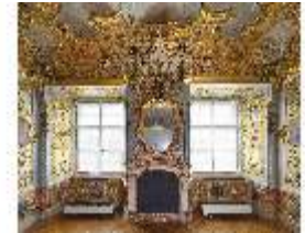
KemRes.II, Schlafzimmer, Wappen, DI015548, BSV-