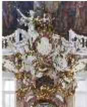
KemRes.II, Thronsaal, Thronnische, Wappen, DI015596, BSV-