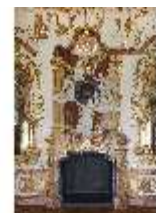
KemRes.II, Audienzzimmer, Kamin, DI015577, BSV-