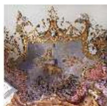
KemRes.II, Tagzimmer, Eckkartusche, DI015568, BSV-