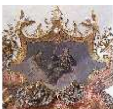
KemRes.II, Tagzimmer, Eckkartusche, DI015567, BSV-