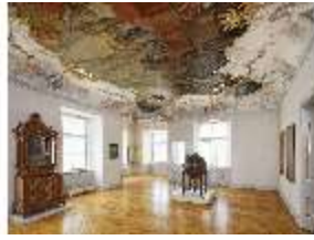
KemRes.II, Kanzlei, DI015543, BSV-