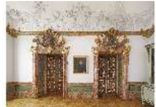
KemRes.II, Vorsaal, DI015586, BSV-