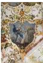
KemRes.II, Audienzzimmer, Eckkartusche, DI015581, BSV-