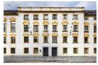
KemRes.I, Südfassade, Eingangsbereich, DI015610, BSV-