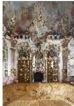
KemRes.II, Thronsaal, DI015593, BSV-