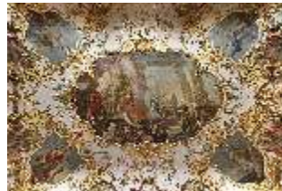
KemRes.II, Audienzzimmer, Deckengemälde, DI015578, BSV-