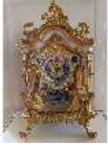
KemRes.III,U, Prunkuhr, Pendule, KemRes.L-U0001, DI023756, BSV