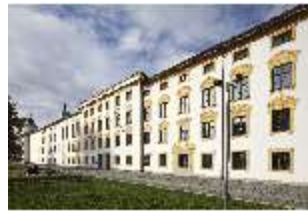
KemRes.I, Südfassade, DI015609, BSV-