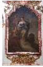
KemRes.II, Tagzimmer, Ölgemälde Kardinaltugend, DI015560, BSV-