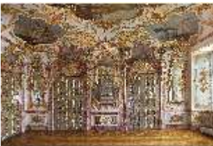
KemRes.II, Audienzzimmer, DI015576, BSV-