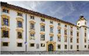
KemRes.I, Außenfassade, DI015608, BSV-