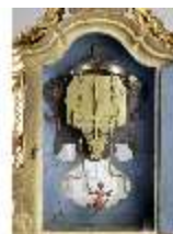
KemRes.III,U, Prunkuhr mit Schaukelpendel, KemRes.U0002, DI011719, RSV