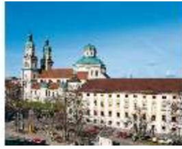
KemRes.I, Stiftskirche und Südtrakt, DE001276, BSV-