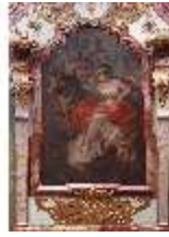
KemRes.II, Tagzimmer, Ölgemälde Kardinaltugend, DI015562, BSV-