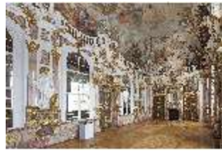
KemRes.II, Thronsaal, DI015589, BSV-