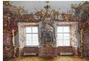
KemRes.II, Tagzimmer, DI015556, BSV-