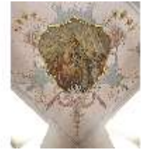
KemRes.II, Kanzlei, Deckenfresko, DI015545, BSV-