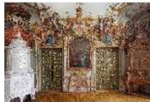
KemRes.II, Tagzimmer, DI015555, BSV-