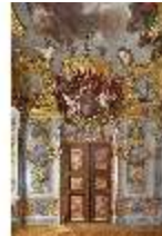
KemRes.II, Schlafzimmer, Supaporte, DI015549, BSV-