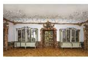
KemRes.II, Vorsaal, DI015585, BSV-