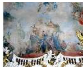
KemRes.II, Thronsaal, Deckengemälde, ü. Nordwand, östl., DE002316, BSV-