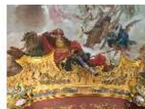
KemRes.II, Deckenbild (Det.), Schlafzimmer, DI019598, BSV