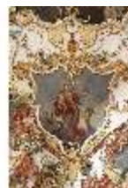
KemRes.II, Audienzzimmer, Eckkartusche, DI015583, BSV-