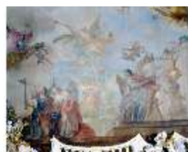
KemRes.II, Thronsaal, Deckengemälde, ü. Südwand, westl., DE002314, BSV-