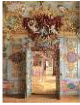
KemRes.II, Enfilade, Prunkräume, DI019594, BSV