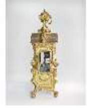
KemRes.III,U, Prunkuhr mit Schaukelpendel, KemRes.U0002, DI011724, RSV