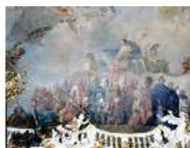
KemRes.II, Thronsaal, Deckengemälde, ü. Südwand, östl., DE002315, BSV-