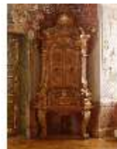
KemRes.III.M, Kabinettschrank, DE000457, BSV-