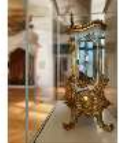
KemRes.III,U, Prunkuhr, Pendule, KemRes.L-U0001, DI023759, BSV