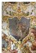
KemRes.II, Audienzzimmer, Eckkartusche, DI015582, BSV-