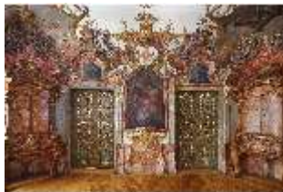
KemRes.II, Tagzimmer, DI015554, BSV-