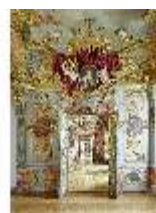
KemRes.II, Enfilade, DI011348, BSV-