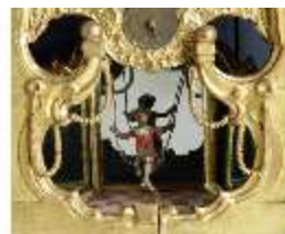
KemRes.III,U, Prunkuhr mit Schaukelpendel, KemRes.U0002, DI011713, RSV