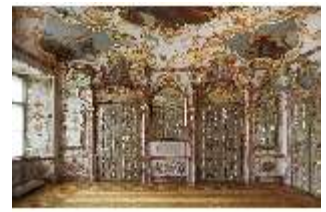
KemRes.II, Audienzzimmer, DI015575, BSV-