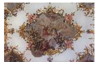
KemRes.II, Tagzimmer, Deckengemälde, DI015566, BSV-