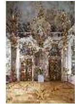
KemRes.II, Thronsaal, DI015592, BSV-