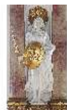
KemRes.II, Thronsaal, Längsseite, Allegorie, DI015600, BSV-