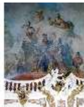
KemRes.II, Thronsaal, Ausschnitt Decke, DE002317, BSV-