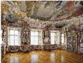
KemRes.II, Audienzzimmer, DI015572, BSV-