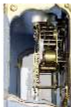
KemRes.III,U, Prunkuhr mit Schaukelpendel, KemRes.U0002, DI011718, RSV