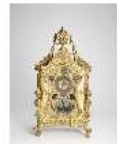
KemRes.III,U, Prunkuhr mit Schaukelpendel, KemRes.U0002, DI011711, RSV