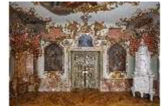
KemRes.II, Tagzimmer, DI015557, BSV-