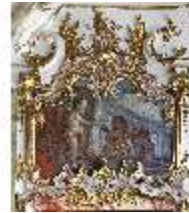
KemRes.II, Thronsaal, Supraporte, DI015606, BSV-