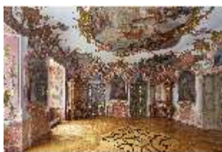
KemRes.II, Tagzimmer, DI015558, BSV-