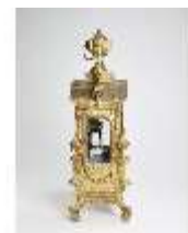
KemRes.III,U, Prunkuhr mit Schaukelpendel, KemRes.U0002, DI011716, RSV