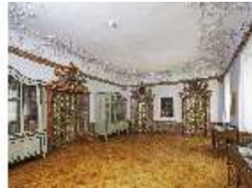
KemRes.II, Vorsaal, DI015584, BSV-