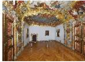
KemRes.II, Schlafzimmer, DI015551, BSV-