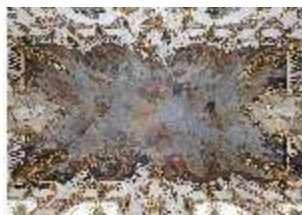
KemRes.II, Thronsaal, Deckengemälde, DI015591, BSV-