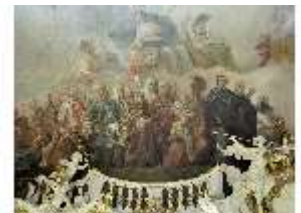
KemRes.II, Thronsaal, Deckengemälde, DI011346, BSV-