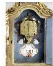
KemRes.III,U, Prunkuhr mit Schaukelpendel, KemRes.U0002, DI011720, RSV