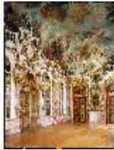
KemRes.II, Thronsaal, DE001278, BSV-