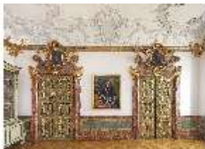
KemRes.II, Vorsaal, DI015587, BSV-