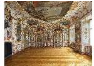
KemRes.II, Audienzzimmer, DI015571, BSV-