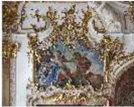
KemRes.II, Thronsaal, Supraporte, DI015604, BSV-