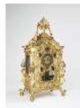
KemRes.III,U, Prunkuhr mit Schaukelpendel, KemRes.U0002, DI011715, RSV