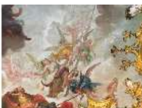
KemRes.II, Deckenbild (Det.), Schlafzimmer, DI019596, BSV