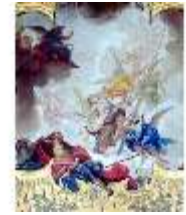
KemRes.II, Schlafzimmer, Deckenbild, DE002222, BSV-