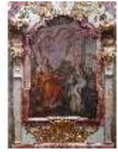
KemRes.II, Tagzimmer, Ölgemälde Kardinaltugend, DI015563, BSV-