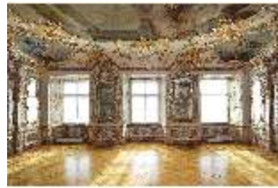
KemRes.II, Audienzzimmer, DI015573, BSV-