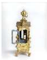
KemRes.III,U, Prunkuhr mit Schaukelpendel, KemRes.U0002, DI011717, RSV