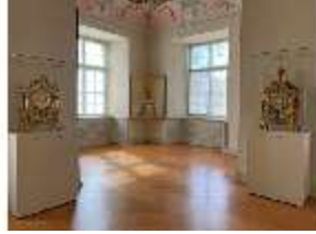
KemRes.III,U, Prunkuhr, Pendule, KemRes.L-U0001, DI023757, BSV