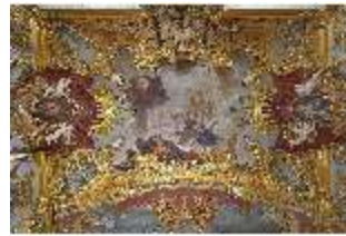
KemRes.II, Schlafzimmer, Deckenfresko, DI015547, BSV-