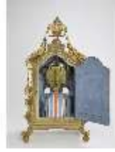
KemRes.III,U, Prunkuhr mit Schaukelpendel, KemRes.U0002, DI011723, RSV