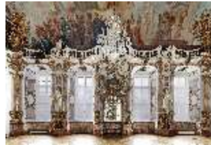
KemRes.II, Thronsaal, DI015595, BSV-