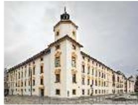
KemRes.I, Südwestlicher Eckturm, DI015611, BSV-