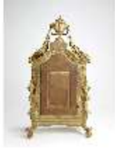
KemRes.III,U, Prunkuhr mit Schaukelpendel, KemRes.U0002, DI011722, RSV