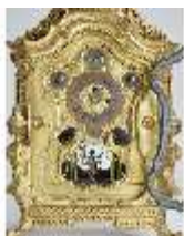
KemRes.III,U, Prunkuhr mit Schaukelpendel, KemRes.U0002, DI011712, RSV