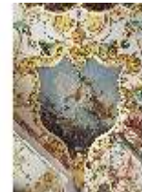
KemRes.II, Audienzzimmer, Eckkartusche, DI015580, BSV-