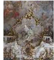
KemRes.II, Thronsaal, Allegorie der Geometrie, DI015599, BSV-