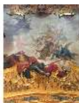
KemRes.II, Deckenbild (Det.), Schlafzimmer, DI019597, BSV