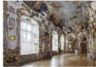
KemRes.II, Thronsaal, DI015590, BSV-