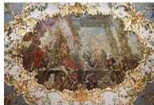
KemRes.II, Audienzzimmer, Deckengemälde, DI015579, BSV-