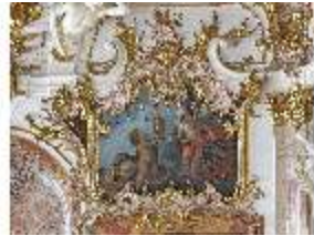
KemRes.II, Thronsaal, Supraporte, DI015605, BSV-