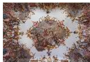
KemRes.II, Tagzimmer, Deckengemälde, DI015565, BSV-