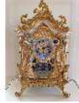
KemRes.III,U, Prunkuhr, Pendule, KemRes.L-U0001, DI023758, BSV