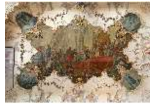
KemRes.II, Kanzlei, Deckenfresko, DI015544, BSV-