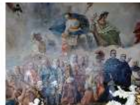
KemRes.II, Thronsaal, Ausschnitt Decke, DE002318, BSV-