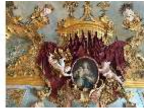
KemRes.II, "Schmerzensmutter", Supraporte, DI019595, BSV