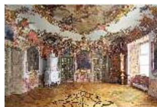
KemRes.II, Tagzimmer, DI015559, BSV-