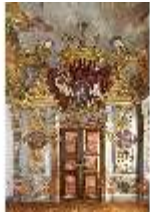
KemRes.II, Schlafzimmer, DI015550, BSV-