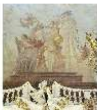
KemRes.II, Thronsaal, Deckengemälde, DI011347, BSV-