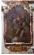
KemRes.II, Tagzimmer, Ölgemälde Kardinaltugend, DI015561, BSV-