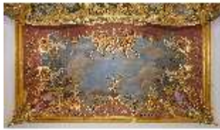
KemRes.II, Schlafzimmer, Deckenfresko, DI015546, BSV-