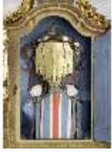
KemRes.III,U, Prunkuhr mit Schaukelpendel, KemRes.U0002, DI011721, RSV

Beschreibung Kempten Stadtresidenz, Stand: Januar 2023