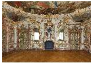
KemRes.II, Audienzzimmer, DI015574, BSV-