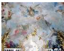
KemRes.II, Thronsaal, Deckengemälde, ü. Ostwand, DE002747, BSV-