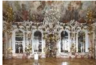
KemRes.II, Thronsaal, DI015594, BSV-