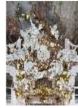
KemRes.II, Thronsaal, nördliches Portal, DI015597, BSV-