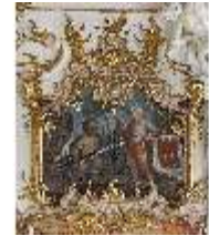
KemRes.II, Thronsaal, Supraporte, DI015607, BSV-