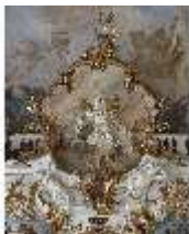
KemRes.II, Thronsaal, Allegorie der Wissenschaft, DI015598, BSV-