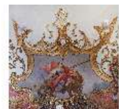
KemRes.II, Tagzimmer, Eckkartusche, DI015570, BSV-