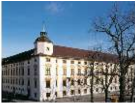
KemRes.I, Südwestecke, DE001277, BSV-