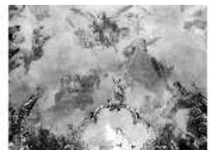
KemRes.II, Thronsaal, Deckengemälde, ü. Ostwand, DE002746, BSV-