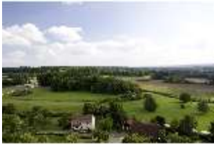
Sa.V, Blick vom Bergfried zum Zschokkefelsen und Gollersfelsen, DI008218, BSV-