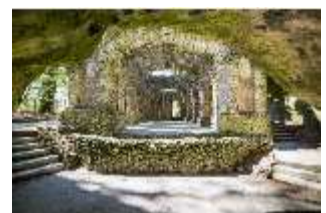
Sa.V, Felsengarten Sanspareil, Ruinentheater, DI004223, BSV-