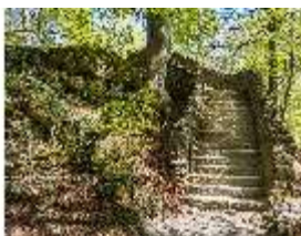
Sa.V, Treppe zum Belvedere der Wilhelmine, DI007868, BSV-