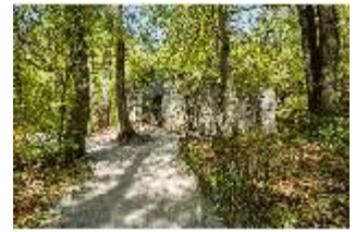
Sa.V, die Kulissengassen des Ruinentheaters, DI007786, BSV-