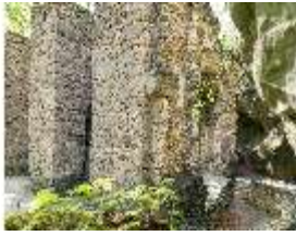
Sa.V, Ruinentheater, Kulissengassen, DI007922, BSV-

Beschreibung Bayreuth Sanspareil Felsengarten, Stand: Januar 2023