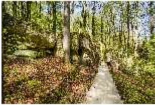
Sa.V, Waldzone, Spazierweg am Felsen der Liebe, DI007777, BSV-