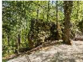
Sa.V, Spazierweg und Felsen, DI007823, BSV-