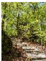
Sa.V, Waldzone, Stufen zwischen den Felsen, DI007836, BSV-