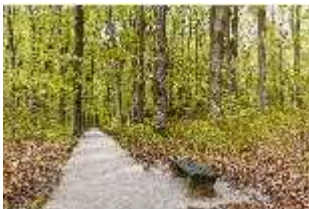
Sa.V, Waldzone, Spazierweg mit Sitzbank, DI007889, BSV-