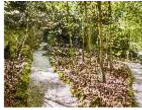
Sa.V, Vulkanshöhle, DI007838, BSV-