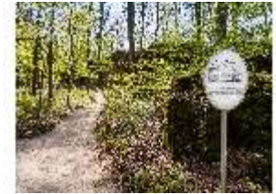
Sa.V, Waldzone mit Hinweistafel zur Burgzwernitz, DI007828, BSV-