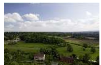
Sa.V, Blick vom Bergfried zum Zschokkefelsen und Gollersfelsen, DI008217, BSV-