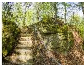
Sa.V, Treppe zwischen den Felsen, DI007898, BSV-