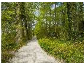
Sa.V, Waldzone, Spazierweg, DI007902, BSV-