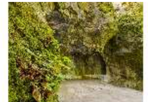
Sa.V, Blick in die Vulkanshöhle, DI007841, BSV-