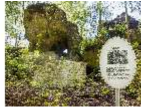
Sa.V, Hühnerloch, DI007827, BSV-