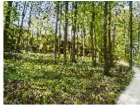
Sa.V, Waldzone, Spazierweg, DI007832, BSV-