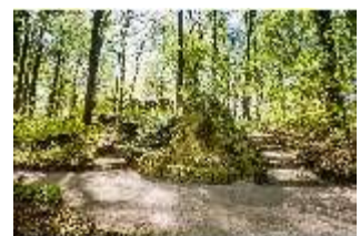
Sa.V, Waldzone, Treppen am Felsen der Minerva, DI007778, BSV-