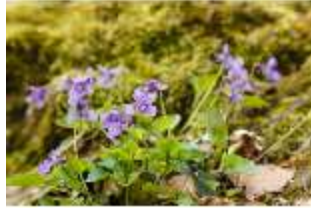
Sa.V, Waldzone, Veilchen (Detail), DI007891, BSV-