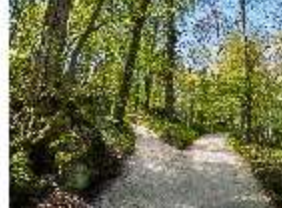
Sa.V, Waldzone, Weggabelung, DI007830, BSV-