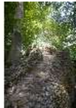
Sa.V, Treppe zum Belvedere der Wilhelmine, DI019401, BSV