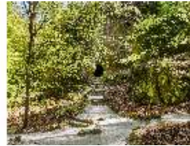
Sa.V, die Bärenhöhle, DI007856, BSV-