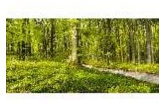
Sa.V, Waldzone, Spazierweg, DI007913, BSV-