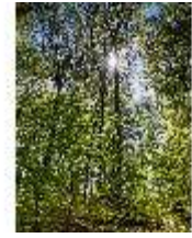
Sa.V, Waldzone, DI007859, BSV-