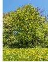
Sa.V, Buchen an der Strohhauswiese, DI007851, BSV-