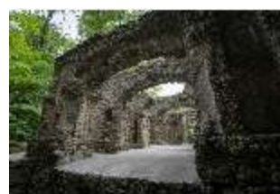
Sa.V, Ruinentheater, Felsengarten, DI019400, BSV