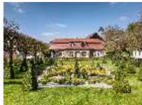
Sa.V, Parterre vorm Küchenbau, DI007818, BSV-