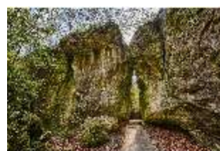
Sa.V, Gespaltener Felsen, DI007883, BSV-