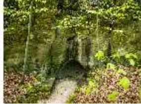
Sa.V, Sirengrotte mit zwei Steinbänken, DI007915, BSV-