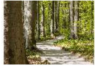
Sa.V, Waldzone, Spazierweg, DI007848, BSV-