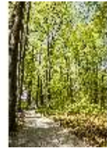
Sa.V, Waldzone, Spazierweg, DI007787, BSV-