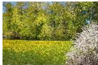
Sa.V, Blick auf blühende Strohhausewiese, DI007850, BSV-