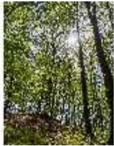
Sa.V, Waldzone, DI007860, BSV-