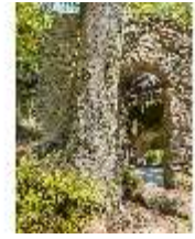
Sa.V, Ruinentheater, Rückseite des Bühnenprospekts, DI007845, BSV-