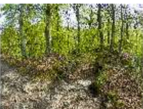
Sa.V, Treppe zwischen den Felsen, DI007896, BSV-