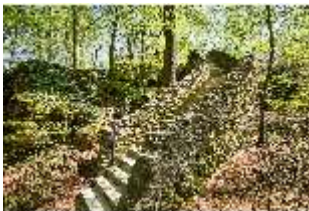
Sa.V, Treppe zum Belvedere der Wilhelmine, DI007783, BSV-