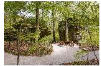
Sa.V, Ehemaliger Grüner Tisch, DI007880, BSV-