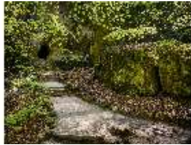
Sa.V, die Bärenhöhle, DI007855, BSV-