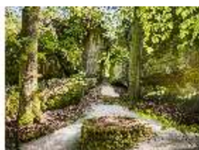
Sa.V, Gespaltener Felsen, DI007852, BSV-