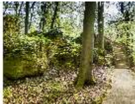
Sa.V, Treppe zum Belvedere der Wilhelmine, DI007916, BSV-