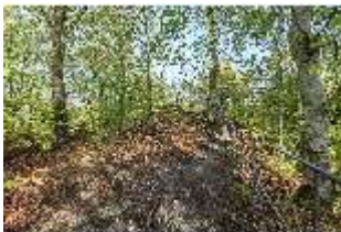
Sa.V, Waldzone, ehemaligen Standort Holzstoßhäuschen, DI007873, BSV-