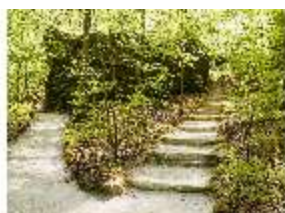
Sa.V, Waldzone, Treppenstufen Richtung Dianengrotte, DI007835, BSV-