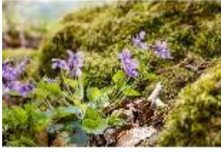
Sa.V, Waldzone, Veilchen (Detail), DI007890, BSV-

Beschreibung Bayreuth Sanspareil Felsengarten, Stand: Januar 2023