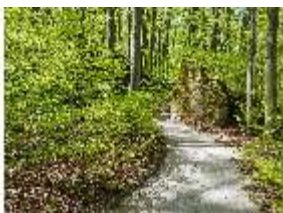
Sa.V, Waldzone, Spazierweg zwischen Felsen, DI007843, BSV-