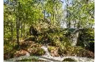
Sa.V, Aeolusfelsen mit Aussichtsplattform, DI007796, BSV-