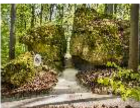
Sa.V, Felsen der Liebe und Pansitz, DI007865, BSV-