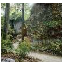
Sa.V, Felsengarten, "Gespaltener Felsen", DI001960, BSV-