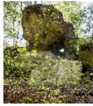
Sa.V, Hühnerloch, DI007826, BSV-