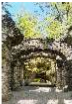
Sa.V, Blick durch das Ruinentheater in die Kalypsogrotte, DI007925, BSV-