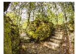
Sa.V, Treppen zwischen den Felsen, DI007899, BSV-