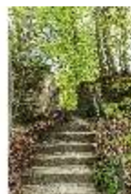
Sa.V, Waldzone, Treppe zum ehemaligen Holzstoßhäuschen, DI007874, BSV-