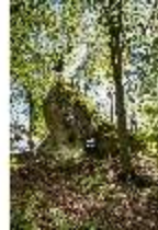
Sa.V, Aeolusgrotte, DI007799, BSV-