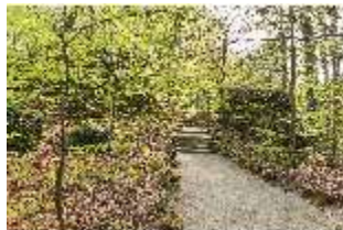
Sa.V, Waldzone, Spazierweg vom Morgenländischen Bau in den Felsengarten, DI007872, BSV-