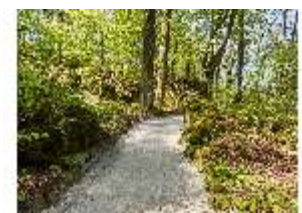
Sa.V, Waldzone, Spazierweg, DI007829, BSV-