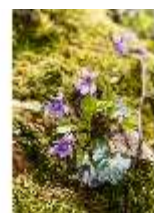
Sa.V, Waldzone, Veilchen (Detail), DI007894, BSV-