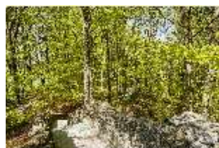
Sa.V, Blick vom Belvedere der Wilhelmine, DI007784, BSV-