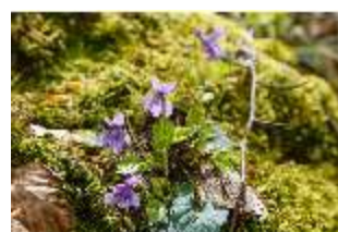
Sa.V, Waldzone, Veilchen (Detail), DI007893, BSV-