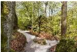
Sa.V, Ehemaliger Grüner Tisch, DI007881, BSV-