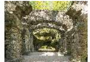
Sa.V, Blick durch das Ruinentheater auf die Kalypsogrotte, DI007924, BSV-