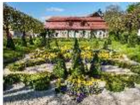
Sa.V, Parterre vorm Küchenbau, DI007819, BSV-