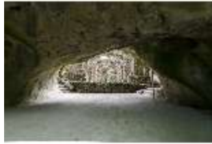
Sa.V, Kalypsogrotte und Ruinentheater, Felsengarten, DI019399, BSV