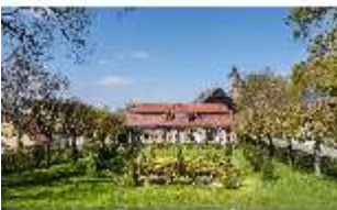
Sa.V, Parterre vorm Küchenbau, DI007817, BSV-