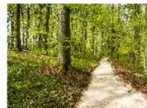
Sa.V, Waldzone, Spazierweg, DI007912, BSV-