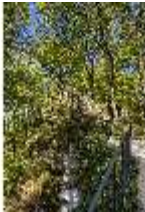
Sa.V, ehemaliger Aeolusturm auf dem Aeolusfelsen, DI007801, BSV-