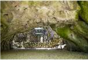
Sa.V, Kalypsogrotte mit Blick auf das Ruinentheater, DI007781, BSV-