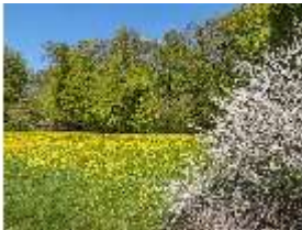
Sa.V, Blick auf blühende Strohhausewiese, DI007849, BSV-