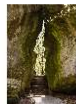
Sa.V, Gespaltener Felsen, DI007887, BSV-