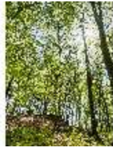
Sa.V, Waldzone, DI007861, BSV-