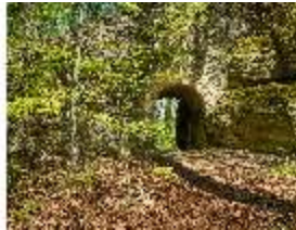
Sa.V, Torbogen unter der Treppe zum Belvederefelsen, DI007846, BSV-