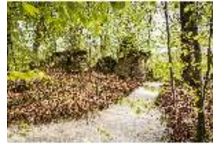
Sa.V, Waldzone, Spazierweg an den Felsen, DI007877, BSV-