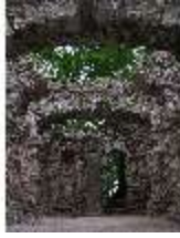
Sa.I, Ruinentheater, DI022558, BSV-