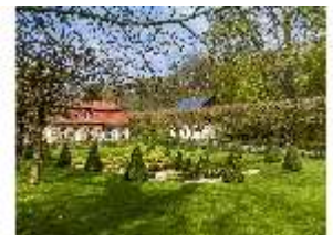
Sa.V, Parterre vorm Küchenbau, DI007918, BSV-