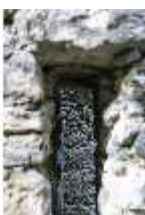
Sa.V, Ruinentheater (Detail) ?, DI019398, BSV