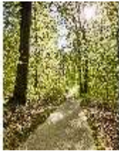
Sa.V, Waldzone, Spazierweg, DI007774, BSV-