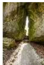
Sa.V, Felsengarten Sanspareil, Gespaltener Felsen, DI004225, BSV-