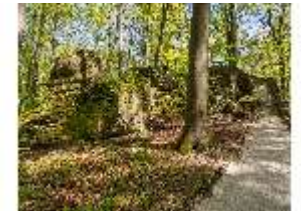
Sa.V, Treppe zum Belvedere der Wilhelmine, DI007867, BSV-