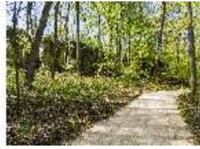
Sa.V, Waldzone, Spazierweg, DI007831, BSV-