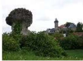
Sa.V, Zschokkefelsen, DI022560, BSV-