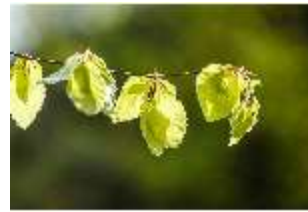
Sa.V, Waldzone, Blick in Baumblätter, DI007886, BSV-