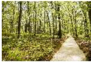
Sa.V, Waldzone, Spazierweg, DI007775, BSV-