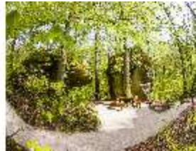
Sa.V, Ehemaliger Grüner Tisch, DI007910, BSV-