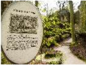
Sa.V, Gespaltener Felsen mit Hinweistafel, DI007909, BSV-