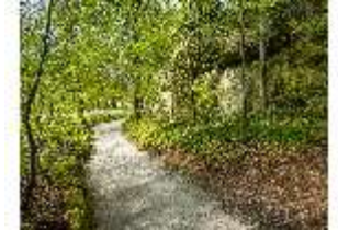
Sa.V, Waldzone, Spazierweg an den Felsen, DI007905, BSV-