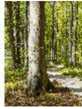
Sa.V, Waldzone, Spazierweg, DI007847, BSV-