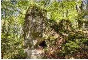
Sa.V, Sibyllengrotte, DI007792, BSV-