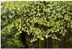
Sa.V, Waldzone, Blick in Baumblätter, DI007884, BSV-