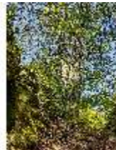
Sa.V, Felsen, DI007857, BSV-