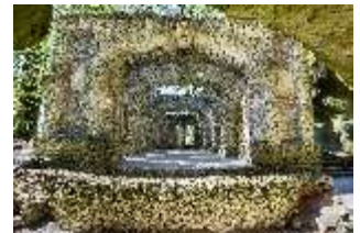
Sa.V, Ruinentheater, DI007782, BSV-