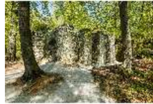
Sa.V, Kulissengassen des Ruinentheaters, DI007785, BSV-