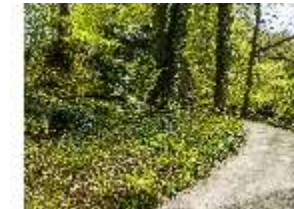
Sa.V, Waldzone, Spazierweg zu den Felsen, DI007904, BSV-