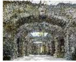
Sa.V, Ruinentheater, Medusenhaupt, DI007919, BSV-