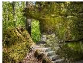
Sa.V, Pansitz (AF 14), DI007866, BSV-