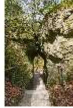
Sa.V, Weg zwischen dem Gespaltenen Felsen, DI007888, BSV-