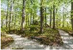
Sa.V, Weggabelung zwischen Ruinentheater und Belvederefelsen, DI007803, BSV-