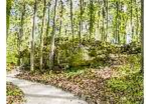
Sa.V, Weg zum Felsen der Liebe und Pansitz, DI007863, BSV-