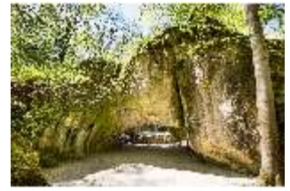
Sa.V, Kalypsogrotte, DI007780, BSV-