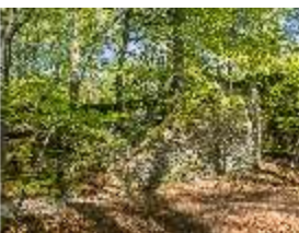
Sa.V, Treppe zum Belvedere der Wilhelmine, DI007870, BSV-