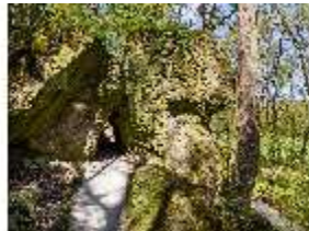
Sa.V, Eiskeller, DI007825, BSV-