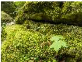
Sa.V, moosbedeckter Felsen, DI007901, BSV-