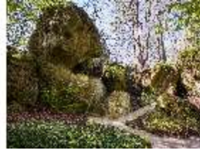
Sa.V, Zwischen Eiskeller und Hühnerloch, DI007824, BSV-