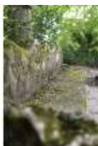
Sa.V, Felsengarten (Detail einer Stufe), DI019397, BSV