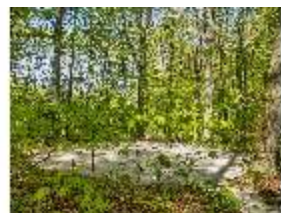
Sa.V, Waldzone, Spazierweg, DI007903, BSV-