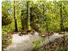
Sa.V, Ehemaliger Grüner Tisch, DI007907, BSV-