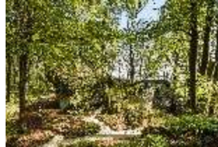
Sa.V, Aeolusfelsen mit Aussichtsplattform, DI007798, BSV-