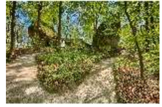
Sa.V, Aeolusfelsen, DI007793, BSV-