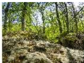
Sa.V, Treppe zwischen den Felsen, DI007897, BSV-