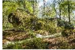
Sa.V, Aeolusfelsen mit Aussichtsplattform, DI007795, BSV-