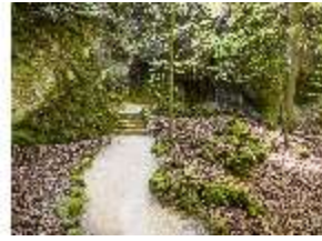
Sa.V, Vulkanshöhle, DI007839, BSV-