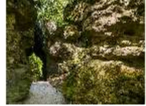
Sa.V, Weg zwischen dem Gespaltenen Felsen, DI007858, BSV-