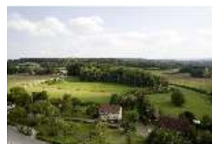
Sa.V, Blick vom Bergfried zum Zschokkefelsen und Gollersfelsen, DI008215, BSV-