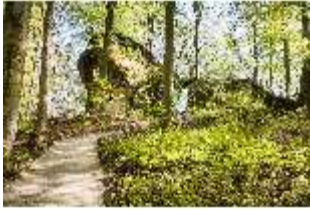
Sa.V, Aeolusfelsen, DI007794, BSV-