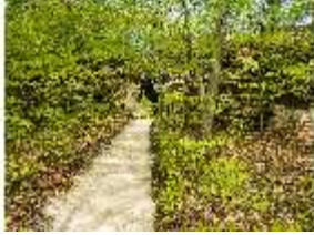
Sa.V, Weg zum Gespaltenen Felsen, DI007911, BSV-