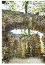
Sa.V, Ruinentheater, letzter Kulissenbogen und Bühnenprospekt, DI007923, BSV-