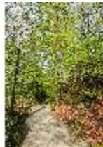
Sa.V, Waldzone, Spazierweg, DI007875, BSV-