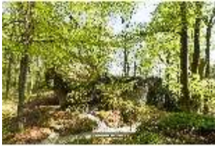
Sa.V, Aeolusfelsen mit Aussichtsplattform, DI007797, BSV-