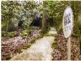
Sa.V, Vulkanshöhle, DI007837, BSV-