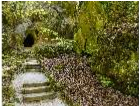
Sa.V, die Bärenhöhle, DI007854, BSV-