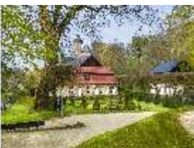
Sa.V, Blick Richtung Parterre und Küchenbau, DI007917, BSV-