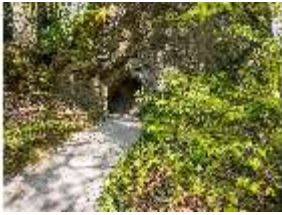
Sa.V, Hühnerloch, DI007821, BSV-