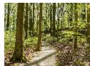
Sa.V, Waldzone, Spazierweg, DI007842, BSV-