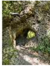
Sa.V, Hühnerloch, DI007822, BSV-