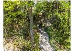
Sa.V, Hühnerloch, DI007820, BSV-