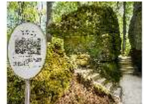
Sa.V, Felsen der Liebe und Pansitz, DI007864, BSV-