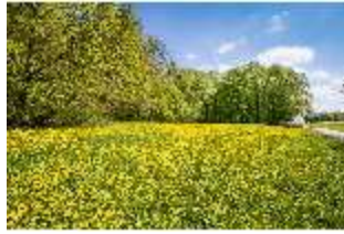
Sa.V, blühende Strohhauswiese, DI007788, BSV-