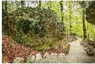
Sa.V, Waldzone, Spazierweg am Regenschirmfelsen, DI007876, BSV-