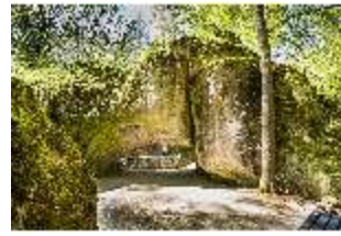
Sa.V, Kalypsogrotte, DI007779, BSV-