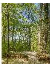
Sa.V, Waldzone, Spazierweg, DI007892, BSV-