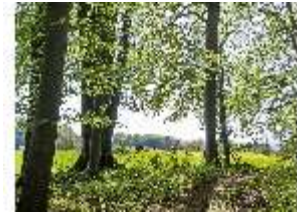
Sa.V, Spazierweg aus der Waldzone Richtung Wiese, DI007927, BSV-