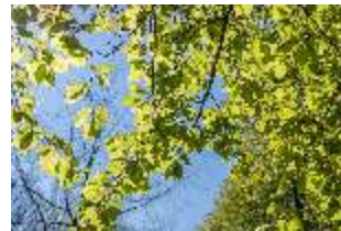
Sa.V, Blick in die Baumkrone, DI007928, BSV-