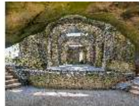
Sa.V, Blick aus Kalypsogrotte auf Ruinentheater, DI007914, BSV-