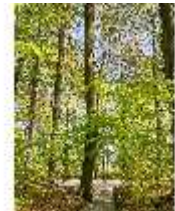
Sa.V, Waldzone, Spazierweg, DI007871, BSV-