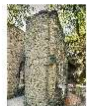
Sa.V, Ruinentheater, Kulissengassen, DI007921, BSV-