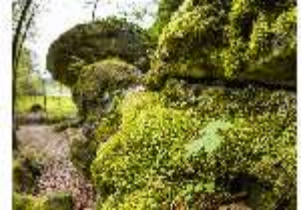
Sa.V, moosbedeckter Felsen, DI007900, BSV-