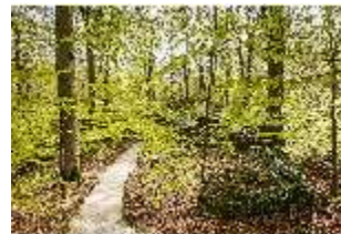
Sa.V, Waldzone, Spazierweg, DI007878, BSV-