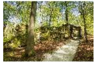
Sa.V, Treppe zum Belvedere der Wilhelmine, DI007804, BSV-