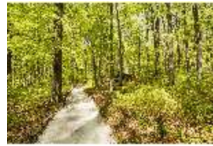
Sa.V, Waldzone, Spazierweg, DI007776, BSV-