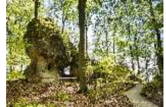
Sa.V, Aeolusgrotte, DI007802, BSV-