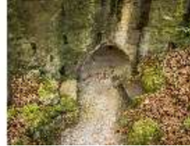
Sa.V, Sirengrotte mit zwei Steinbänken, DI007882, BSV-