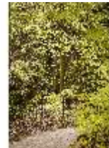
Sa.V, Waldzone, Spazierweg zwischen den Felsen mit Geländer, DI007879, BSV-