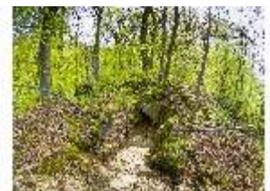
Sa.V, Treppe zwischen den Felsen, DI007895, BSV-