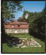
Sa.I, Küchenbau, DE003859, BSV-

Beschreibung Bayreuth Sanspareil Felsengarten, Stand: Januar 2023