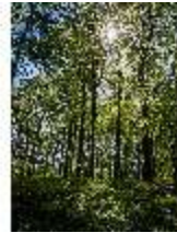
Sa.V, Waldzone, DI007862, BSV-