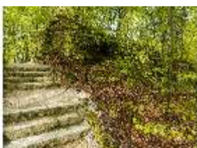
Sa.V, Waldzone, Treppen zwischen den Felsen, DI007906, BSV-