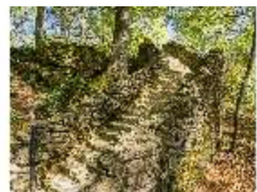
Sa.V, Treppe zum Belvedere der Wilhelmine, DI007869, BSV-