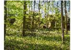
Sa.V, Waldzone, Blick zu den Felsen, DI007833, BSV-