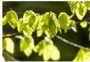
Sa.V, Waldzone, Blick in Baumblätter, DI007885, BSV-