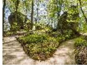
Sa.V, Aeolusfelsen, DI007844, BSV-