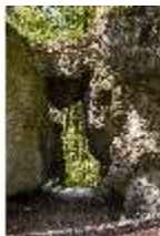
Sa.V, Natürliche Felsenbrücke am Aeolusfelsen, DI007800, BSV-