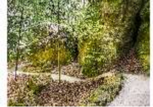
Sa.V, Spazierweg an der Vulkanshöhle, DI007840, BSV-