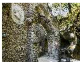
Sa.V, Ruinentheater, erster Bogen, DI007920, BSV-