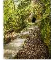
Sa.V, die Bärenhöhle, DI007853, BSV-