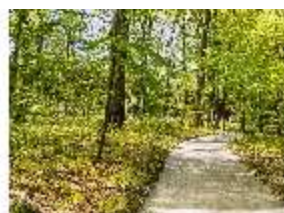
Sa.V, Waldzone, Spazierweg, DI007834, BSV-