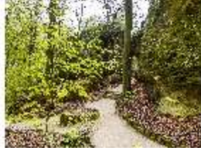
Sa.V, Weg zum Gespaltenen Felsen, DI007908, BSV-