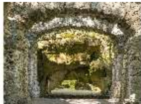
Sa.V, Blick durch das Ruinentheater in die Kalypsogrotte, DI007926, BSV-