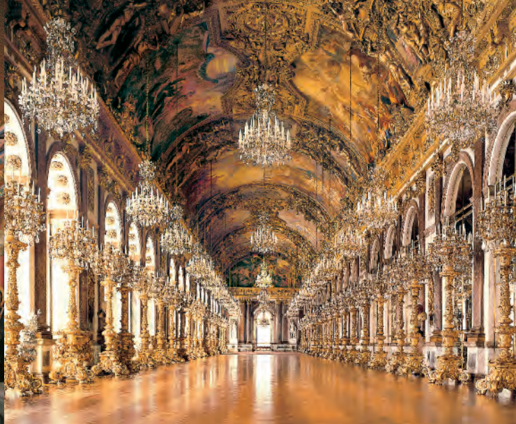
Большая зеркальная галерея во дворце Херренхимзее