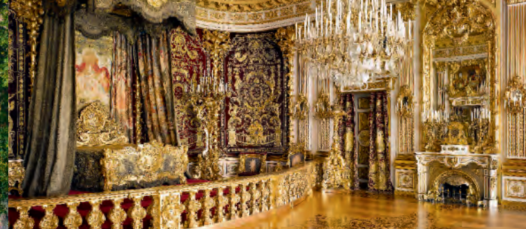
Парадная спальня во дворце Херренхимзее

Вполне возможно, что самой известной в мире королевской постройкой является созданный баварским королем Людвигом II-м дворец Нойшваштайн , притягивающий ежегодно внимание около 1,3 миллионов посетителей. Для строительства этого архитектурного чуда Людвигом II-м были выбраны кулисы просто сказочной красоты – расщепленные трещинами скалистые вершины, бурлящие переливы горной реки и зеркальная гладь озер. Нойшваштайн, как никакое другое архитектурное творение, наглядно демонстрирует мечты и стремления этого «сказочного» короля. Ведь задуман он был не как арена демонстрации королевской власти, а как место уединения, своеобразный приют отшельника. Именно здесь Людвиг II-й погружался в мир своих фантазий и грез – поэтический мир Средневековья. Возведенный и оформленный в стиле средневековых форм, но оснащенный по самому последнему слову техники XIX века, Нойшваштайн представляет собой один из самых впечатляющих архитектурных образцов историзма.