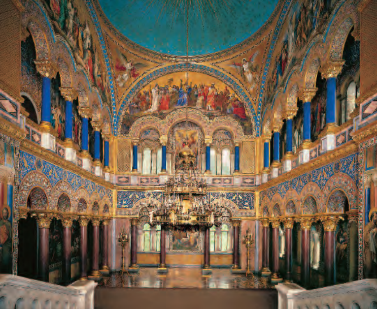
Тронный зал во дворце Нойшванштайн