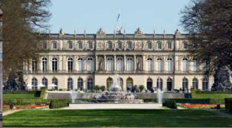
Il Castello di Herrenchiemsee (Castello Nuovo)