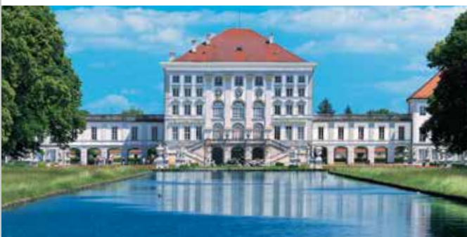
Il Castello di Nymphenburg