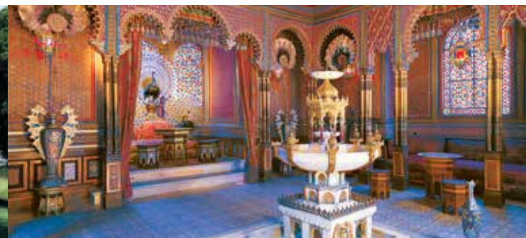
Il Chiosco moresco a Linderhof