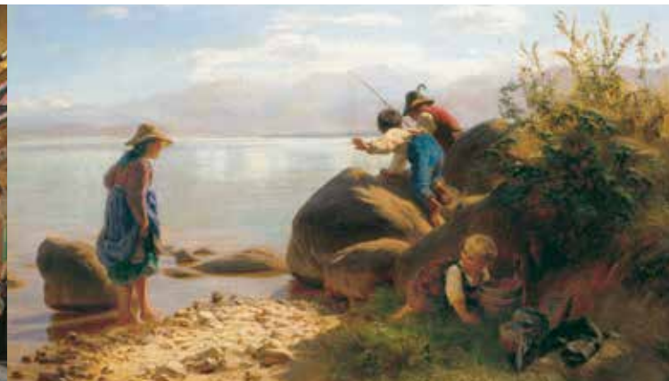
'Bambini che pescano sul lago Chiemsee', F. W. Pfeiffer

Si tratta del più antico convento bavarese (fondato intorno al 640); sede vescovile con Duomo (1215–1808). Allorché Ludovico II, nel 1873, comprò la Herreninsel (Isola dei Signori), fece sistemare delle stanze residenziali all'interno del complesso conventuale barocco. Nel 1948 vi si riunì l'Assemblea Costituente che gettò le basi della Costituzione della Repubblica Federale. Nel museo è documentato questo importante capitolo della storia tedesca. Altre stanze illustrano la lunga e ricca storia del convento. Due gallerie presentano quadri dei cosiddetti Pittori del Chiemsee. Una parte degli appartamenti reali conserva ancora gli arredi autentici. Due sale dell'alto barocco con pitture illusionistiche perfettamente conservate e la sala tardobarocca della Biblioteca di Johann Baptist Zimmermann valgono già da sole la visita di questo importante luogo della storia bavarese.