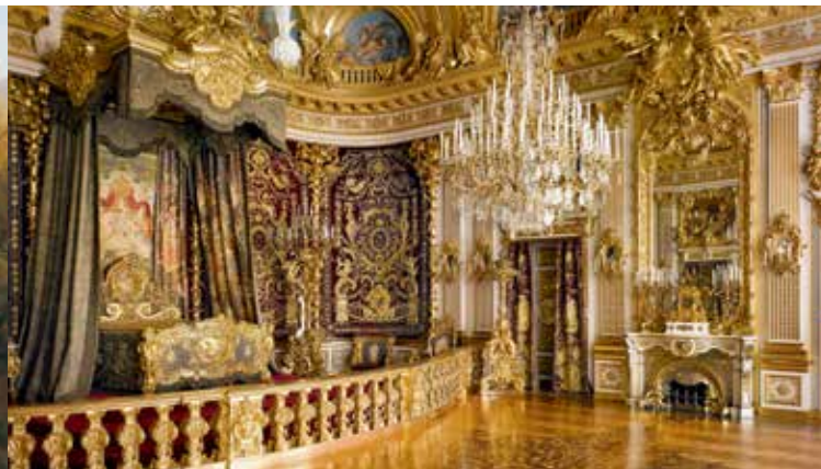
La Stanza da letto da parata nel Castello di Herrenchiemsee

Questo monumento all'assolutismo sorse a partire dal 1878 e superò di molto il suo modello di Versailles nella sontuosità degli arredi. La Stanza da letto da cerimonia nell'Appartamento Grande fu la stanza più dispendiosa del XIX secolo. La dotazione di porcellana dell'Appartamento Piccolo è la più grande committenza singola che la manifattura di Meissen abbia mai ricevuto. I ricami dei tessuti non temono paragoni per ricchezza e qualità. In questo castello Ludovico II ha evocato con estrema coerenza l'ideale di monarchia e gli dato forma con tutti i mezzi. Herrenchiemsee peraltro è rimasto incompiuto come il parco circostante, ispirato al modello di Versailles e ai suoi grandiosi giochi d'acqua, che avrebbe dovuto comprendere la maggior parte dell'isola. Oggigiorno il parco è circondato da un'area allo stato naturale con importanti biotopi. Nel castello l'ampio Museo di Ludovico II illustra la vita e l'operato di questo 'vero unico re dell'Ottocento', come lo definì Paul Verlaine nel 1886.