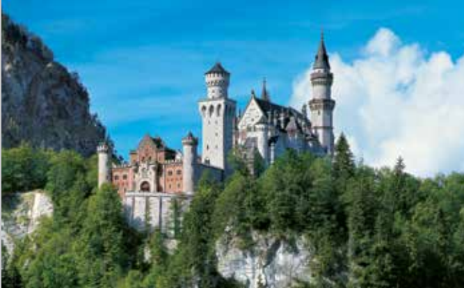
Il Castello di Neuschwanstein