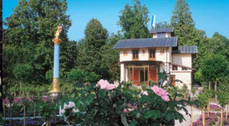
Il giardino delle rose visto dal lato est del villino