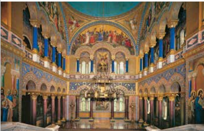
Sala del trono nel Castello di Neuschwanstein

Fatto costruire da Ludovico II a partire dal 1868 in un ambiente intimo e in posizione dominante rispetto al castello paterno di Hohenschwangau, il Castello di Neuschwanstein, mai portato a compimento, simboleggiava per lui un monumento alla cultura e alla regalità medievali, che Ludovico ammirava e ambiva ricostruire. Realizzato e arredato con forme e stili medievali, pur facendo ricorso alla più moderna tecnica di allora, è uno degli edifici più conosciuti al mondo nonché un simbolo fondamentale dell'idealismo tedesco. Gli interni mostrano cicli di dipinti murali di antiche saghe nordiche e cavalleresche. La Sala dei cantori rievoca con un sentimento di venerazione due sale della Fortezza della Wartburg; la Sala del trono, spazio sacrale della monarchia, rimanda alle chiese bizantine e paleocristiane.