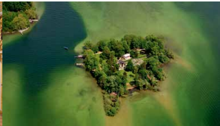
L'Isola delle rose e le circostanti zone di acqua bassa

Ludovico II amava questa isoletta dove si trovava il Casino di suo padre, arredato in stile pompeiano. Negli anni giovanili vi invitò ospiti particolari, ad esempio la zarina russa Maria Alexandrovna. Di tanto in tanto vi si incontrava con l'imperatrice Elisabetta d'Austria, a lui spiritualmente affine. Il giardino delle rose venne ricostruito piantandovi molte specie storiche profumate. Il Casino può essere visitato insieme al suo raffinato arredo, restaurato in modo impeccabile. Nella Casa del giardiniere una piccola mostra informa sulla sorprendente lunga storia dell'isola. I resti di palafitte preistoriche sul fondale del lago di Starnberg intorno all'Isola delle rose sono stati dichiarati Patrimonio mondiale dell'umanità da parte dell'UNESCO. Sulla sponda orientale del lago, prospiciente l'Isola delle rose, si trova la Cappella Votiva. Venne costruita proprio al di sopra del punto in cui Ludovico II trovò la morte, il 13 giugno 1886, nelle vicinanze del suo castello di Berg.