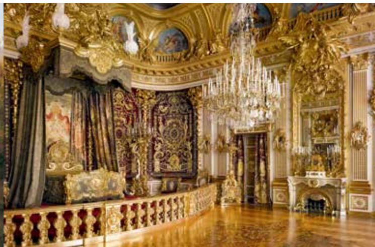
Paradeschlafzimmer in Schloss Herrenchiemsee

Seit 1878 entstand dieses Denkmal des Absolutismus, das sein Vorbild Versailles an Pracht der Ausstattung weit übertrifft. Das Paradeschlafzimmer im Großen Appartement gilt als der teuerste Raum des 19. Jahrhunderts. Die Porzellanausstattung des Kleinen Appartements ist der größte Einzelauftrag, den die Manufaktur Meissen je erhalten hat. Die Stickereien der Textilien suchen in Fülle und Qualität ihresgleichen. Ludwig II. hat in diesem Schloss mit aller Konsequenz und mit allen Mitteln das Königtum beschworen. Es blieb ebenso unvollendet wie der umgebende Park nach Versailler Vorbild mit seinen grandiosen Wasserspielen, der den Großteil der Insel umfassen sollte und heute von freier Natur mit wichtigen Biotopen umgeben ist. Im Schloss dokumentiert das umfangreiche Ludwig II.-Museum Leben und Wirken dieses »einzigen wahren Königs des 19. Jahrhunderts«, wie Paul Verlaine ihn 1886 nannte.