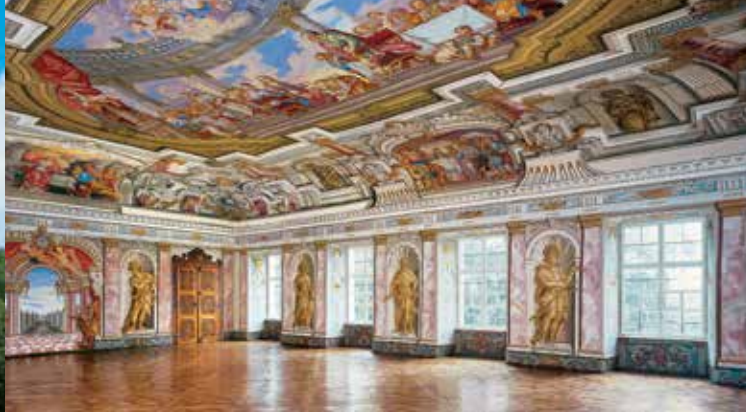
Barocker Kaisersaal im Augustiner-Chorherrenstift