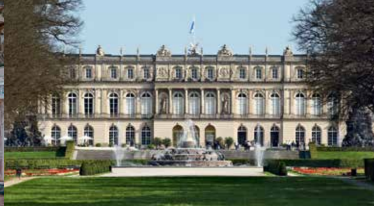
Schloss Herrenchiemsee (Neues Schloss)