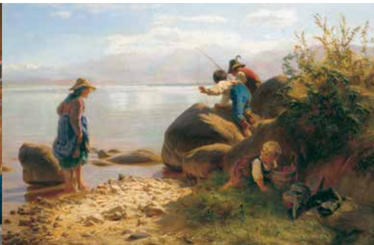
Fischende Kinder am Chiemsee, F. W. Pfeiffer (1822–1891)

Bayerns ältestes Kloster wurde um 640 gegründet, von 1215 bis 1808 war es Bischofssitz mit Dom. Als Ludwig II. 1873 die Herreninsel kaufte, ließ er in den barocken Klostergebäuden Wohnräume einrichten. 1948 tagte hier der Verfassungskonvent, der das Grundgesetz vorbereitete. Dieses wichtige Kapitel deutscher Geschichte ist im Museum dokumentiert. Weitere Räume veranschaulichen die reiche Geschichte des Klosters. Zwei Galerien zeigen Gemälde der Chiemsee-Maler. Ein Teil der königlichen Wohnräume ist authentisch eingerichtet. Der spätbarocke Bibliothekssaal von Johann Baptist Zimmermann und zwei hochbarocke Säle mit Illusionsmalereien lohnen allein schon den Besuch dieses bedeutenden Orts bayerischer Geschichte.