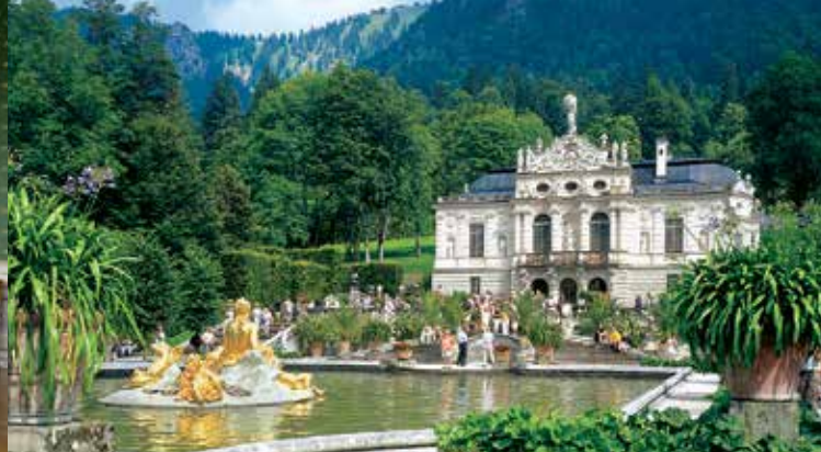
Hauptfassade von Schloss Linderhof