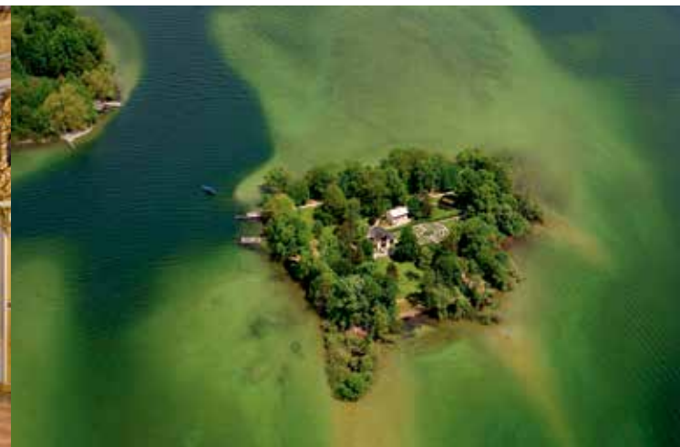
Die Roseninsel und ihre umgebenden Flachwasserzonen

Ludwig II. liebte diese kleine Insel mit dem pompejanisch ausgestatteten Casino seines Vaters. In jungen Jahren lud er besondere Gäste ein, wie etwa die russische Zarin Maria Alexandrowna. Manches Mal traf er sich dort mit der seelenverwandten Elisabeth, Kaiserin von Österreich. Der Rosengarten wurde mit vielen duftenden historischen Sorten rekonstruiert. Das Casino ist mit seiner feinen, aufwendig restaurierten Ausstattung zu besichtigen. Im Gärtnerhaus informiert eine kleine Ausstellung über die erstaunlich lange Geschichte der Insel. Die Überreste prähistorischer Pfahlbauten auf dem Grund des Starnberger Sees an der Roseninsel gehören zum Weltkulturerbe der UNESCO. In Sichtweite liegt am Ostufer des Sees die Votivkapelle. Sie wurde hoch über der Stelle errichtet, an der Ludwig II. am 13. Juni 1886 den Tod fand, unweit seines Schlosses Berg.