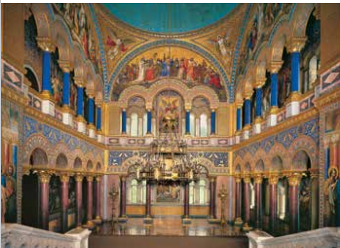
Thronsaal in Schloss Neuschwanstein

Von Ludwig II. seit 1868 hoch über dem Schloss Hohen Schwangau seines Vaters in vertrauter Umgebung errichtet und nie vollendet, war Neuschwanstein für ihn Denkmal der Kultur und des Königtums des Mittelalters, die er verehrte und nachvollziehen wollte. Das Schloss, das zwar in mittelalterlichen Formen, aber mit damals modernster Technik gestaltet und ausgestattet wurde, zählt zu den weltweit bekanntesten Bauwerken und ist ein Hauptsymbol des deutschen Idealismus. Die Innenräume zeigen Wandbilderzyklen aus altnordischen und ritterlichen Sagen. Der Sängersaal zitiert verehrend zwei Säle der Wartburg, der Thronsaal – ein Kultraum des Herrschertums – byzantinische und frühchristliche Kirchenräume.