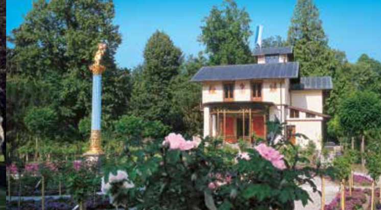
Der Rosengarten vor der Ostseite des Casinos