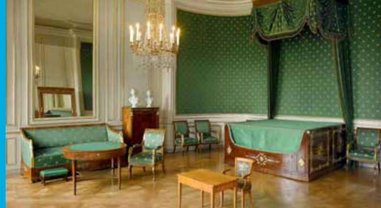
Das Geburtszimmer Ludwigs II. in Schloss Nymphenburg

Bayerischer Staatsminister der Finanzen, für Landesentwicklung und Heimat