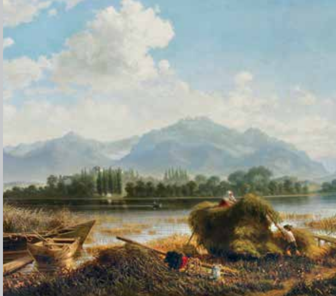
Vista sulla Herreninsel dall'imbarcadere di Urfahrn, utilizzato anche da Ludovico II. Dipinto del 'pittore del Chiemsee' Albin Mattenheimer, 1874