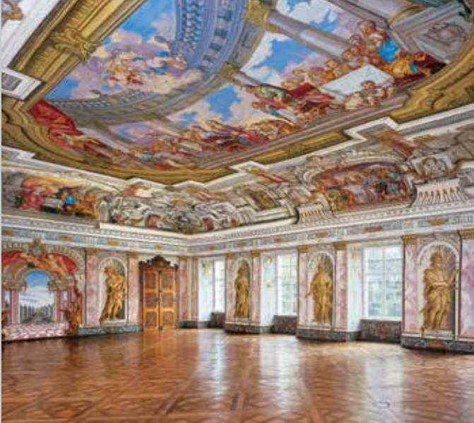
Salone imperiale barocco con dipinti illusionistici sulle pareti e sul soffitto (in alto); dettaglio di un battente della porta nel salone imperiale (in basso)