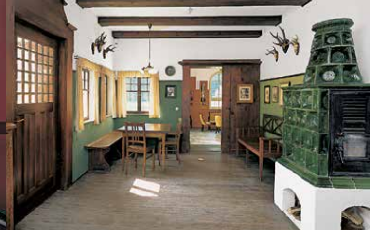
Bauernstube mit Ausstattung aus der Gründerzeit um 1908

Architektur und Dekoration dieses Raumes. Unter den wandfesten Teilen sind ein Marmorkamin so wie ein Wandbrunnen aus Marmor hervorzuheben, dessen Zentrum das Relief eines Putto mit Schwan bildet. Einzelne fehlende Teile der Ausstattung wurden ergänzt, die zugehörige Möbelgarnitur und der Lüster restauriert. Als museale Ausstattung werden im Salon zahlreiche Gemälde von Anna Sophie Gasteiger und ihre Malutensilien gezeigt. Die Künstlerin hat in ihren letzten Lebensjahren nachweislich in diesem Salon gemalt. Die hier aufgestellte, um 1900 entstandene Büste einer Bacchantin gehört zu den namhaften Werken Mathias Gasteigers aus dessen Jugendstilzeit.