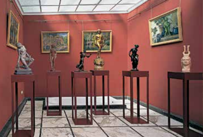
Das ehemalige Bad mit Werken des Künstlerehepaares