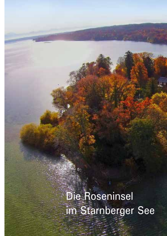
Die Roseninsel im Starnberger See