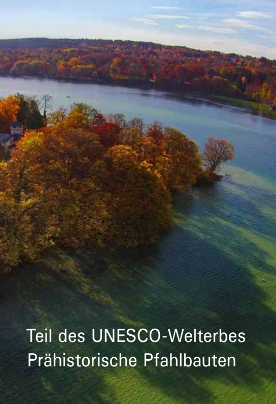
Teil des UNESCO-Welterbes Prähistorische Pfahlbauten

Weitere Informationen finden Sie im Internet: www.unesco-pfahlbauten.org www.blfd.bayern.de www.schloesser.bayern.de