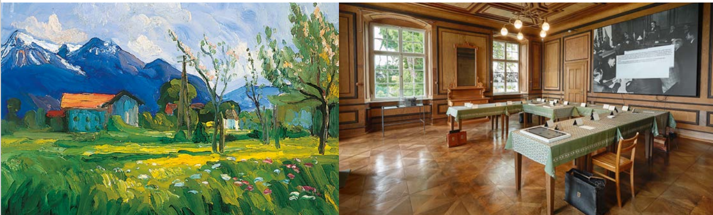
La sala delle riunioni dell'Assemblea Costituente, nel suo aspetto del 1948, offre spazi di riflessione biografici e tematici.